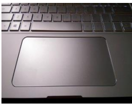
touchpad - panel dotykowy