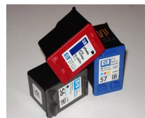
wkłady drukujące, tonery