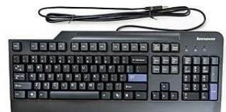
keyboard - klawitura