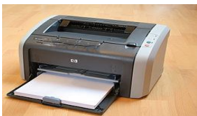
printer - drukarka