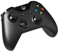
game controller – kontroler do gier