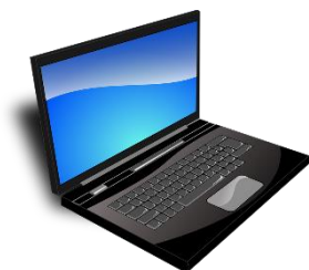
laptop – laptop desktop computer