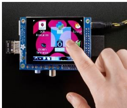
touch screen – ekran dotykowy